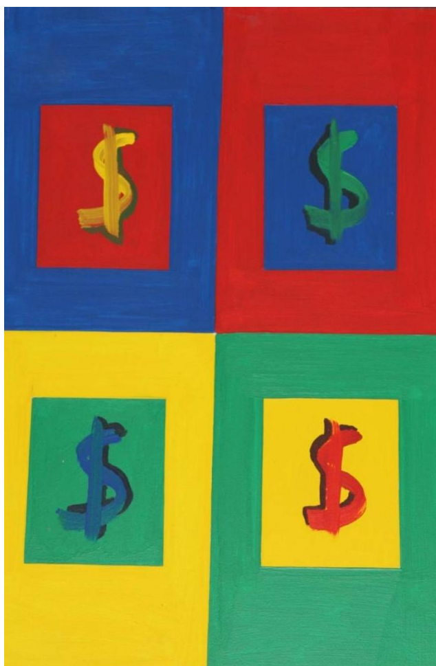
Malet af Allan Soelberg med inspiration fra Andy Warhol

Nogle af hans serigrafier er vel også blandt de mest kopierede kunstværker og har været brugt som inspiration af mange andre Pop Art kunstnere.