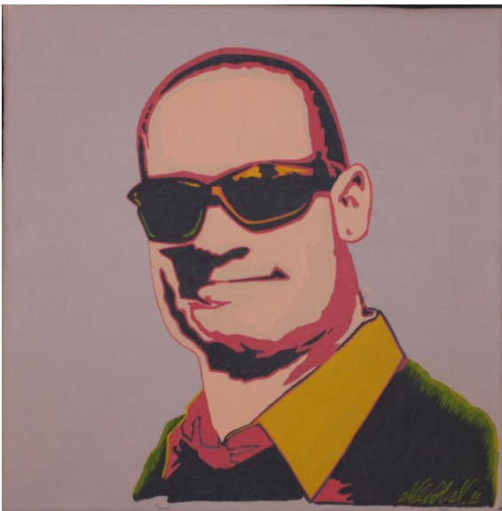
Pop Art inspireret billede

Popkunsten er altså til dels figurativ og en reaktion mod det rene nonfigurative og abstrakte maleri.