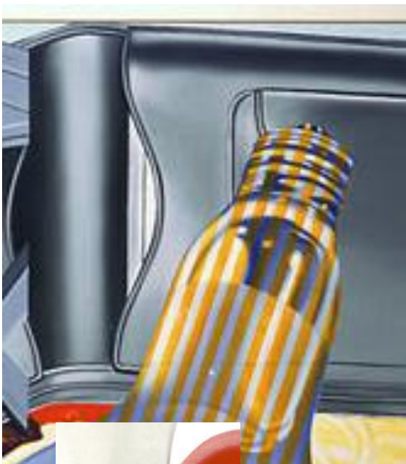
3 beskårede eksempler på ovenstående kunstnere. Øverst til venstre James Rosenquist, til højre Jim Dine og nederst til venstre Tom Wesselmann.