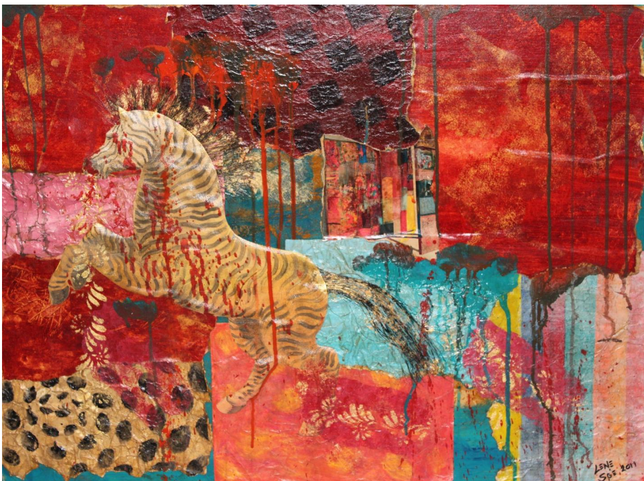
Billede malet af Lene Sørensen efter Robert Rauschenbergs original